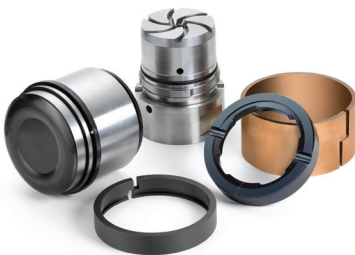
ALOTEC 링-플런저 시스템