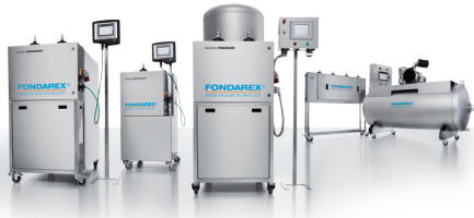
FONDAREX 다이캐스팅 고진공 시스템