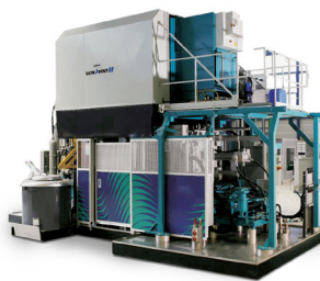
KMA 다이캐스팅 공기 청정시스템