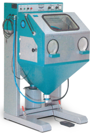
IEPCO 다이캐스팅 금형 표면처리