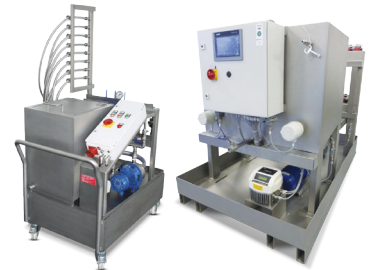
FIMRO 금형 냉각채널 및 스프레이 세척기