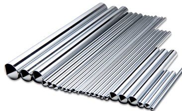
GERHARD SPECKENHEUER GmbH 수퍼 열전도 파이프