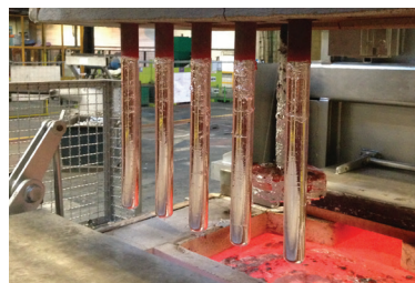
LETHIGUEL 직접 가열 침적식 히터