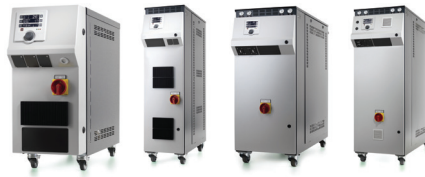
REGLOPLAS 금형 온도조절기