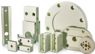
BRANDENBURGER 금형 단열재