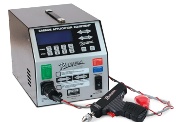
ROCKLINIZER 방전 피막 코팅기